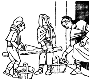
Serra la vella

A les velles, caldo d'estelles, pels hereus, caldo de guineus, per les joves, caldo de polles, pels escolans, un garrot de quatre pams.