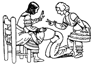
Pim, pam, conillam

L'altre s'alça, i va a cercar aquell que ell