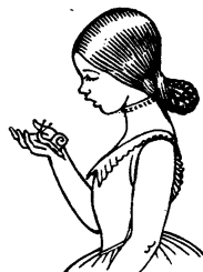
Caragol, treu banya