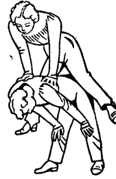
El cavall fort

Si els de baix es cansen i veuen que els de dalt es mantenen forts, diuen: —Fava—. I en sentir-ho, els de dalt salten i es torna a fer el joc. Però si els de dalt han muntat malament, i van relliscant, els de baix han d'aguantar tant com poden, fins que els de dalt han caigut. I si arriben a caure, aleshores els de dalt són els qui paren i els que paraven són els qui han de saltar.